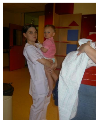
Haute Ecole Condorcet site de Mons